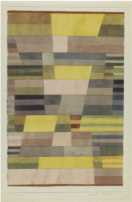
Paul Klee, Monument im Fruchthland, 1929

Fruchthland ist ein anderes Wort für Feld oder Acker.