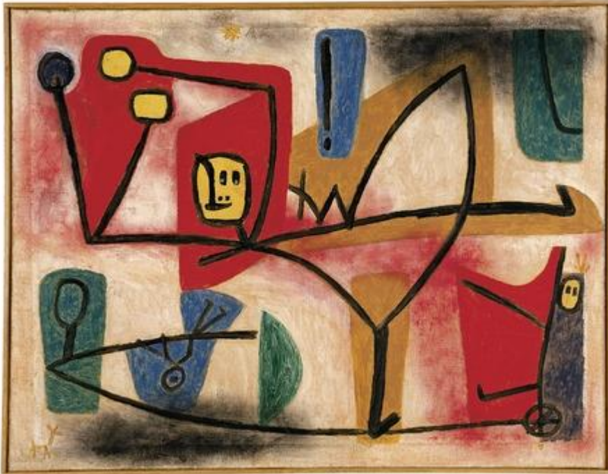
Paul Klee, UeberMut, 1939

Heute mögen ganz viele Menschen die moderne Kunst. Die Kunst-Werke sind heute sehr wertvoll.